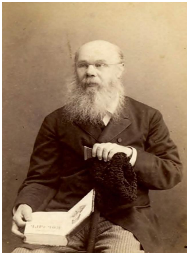
Олександр Якович Кониський (1836-1900)

Abstract. The article is devoted to the personality of Oleksandr Konys'ky (1836–1900), a Ukrainian public figure, enlightener, writer, pedagogue, translator, publisher, lexicographer, professional lawyer, journalist, author of the words of the spiritual hymn “Prayer for Ukraine”, the translator of the Taras Shevchenko Diary, the founder of Shevchenko studies, a bright personality in the Ukrainian social, political and literary process of the second half of the 19 th century.